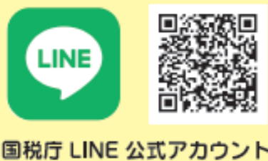
国税庁LINE公式アカウント

確定申告期限(3月15日)間際は大変混み合います。 確定申告会場(イオンモール筑紫野)への来場を検討されている方は、お早めの来場をお願いします。